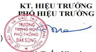
Cù Tuấn Khanh

* Các tiết học buổi chiều là các tiết học thêm của học kỳ 2 năm học 2023 - 2024.