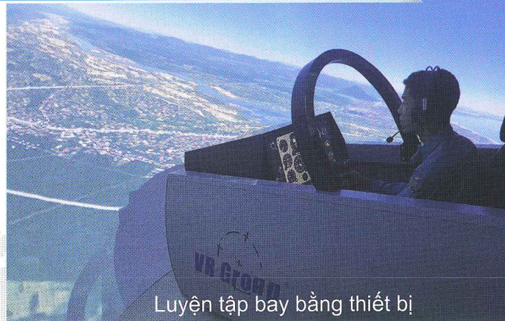
Luyện tập bay bằng thiết bị

Cao đẳng Kỹ thuật hàng không: Được cấp bằng cao đẳng, phong quân hàm thiếu úy, trung úy chuyên nghiệp (căn cứ vào kết quả học tập); được bổ nhiệm chức danh ban đầu nhân viên kỹ thuật hàng không, sẽ phát triển lên Kỹ thuật trưởng theo chuyên ngành đào tạo, có thể được học liên thông đại học