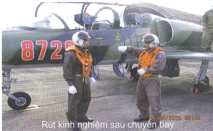
Rút kinh nghiệm sau chuyến bay

Đội ngũ giảng viên có phẩm chất chính trị tốt, có trình độ học vấn cao được đào tạo trong và ngoài nước, có nhiều kinh nghiệm thực tiễn, uy tín chuyên môn và năng lực sư phạm tốt; 100% giảng viên có trình độ đại học và sau đại học, có nhiều nhà giáo ưu tú, nhà giáo giỏi cấp Bộ và cấp cơ sở.