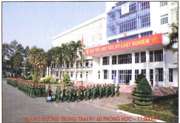
GIẢNG ĐƯỜNG TRUNG TÂM HI 60 PHÒNG HỌC - 11.900m 2

Đội ngũ cán bộ, giảng viên được đào tạo cơ bản tại các nhà trường, học viện trong và ngoài quân đội; có nhiều kinh nghiệm trong huấn luyện, quản lý, chỉ huy đơn vị; có nhiều kinh nghiệm trong thực tiễn chiến đấu. Hiện nay 100% cán bộ giảng viên có trình độ đại học, trong đó có 18 phó giáo sư tiến sĩ, 69 tiến sĩ, 439 thạc sĩ.