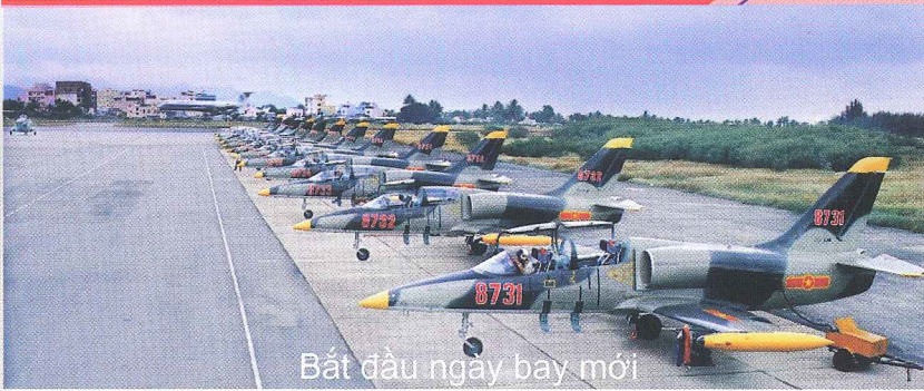
Bắt đầu ngày bay mới