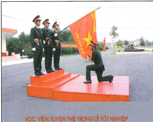
HỌC VIÊN TUYÊN THỆ TRONG LỄ TỐT NGHIỆP