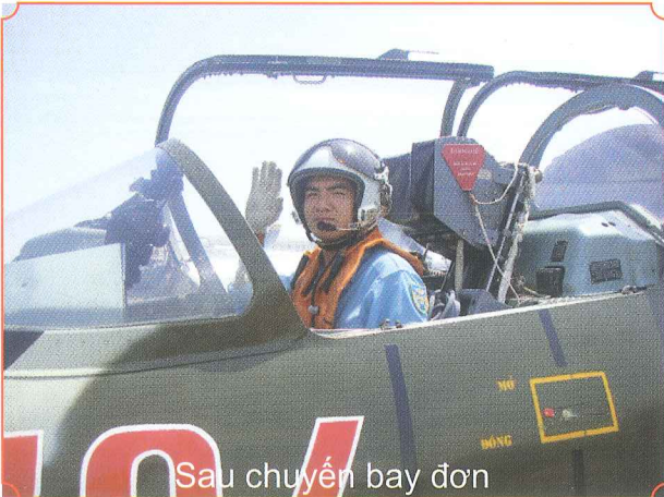
Sau chuyến bay đơn

Đào tạo những quân nhân, thanh niên có đủ tiêu chuẩn quy định trở thành Kỹ thuật trưởng theo các chuyên ngành đào tạo, có phẩm chất chính trị tốt, có trình độ khai thác Kỹ thuật Hàng không.